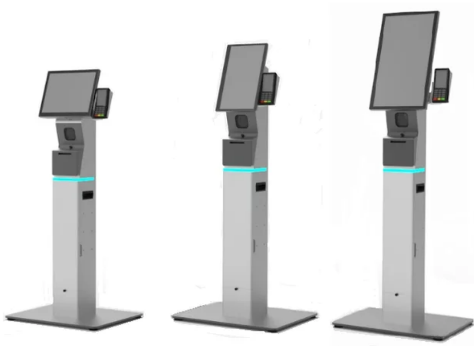
フロアスタンド（自立型）