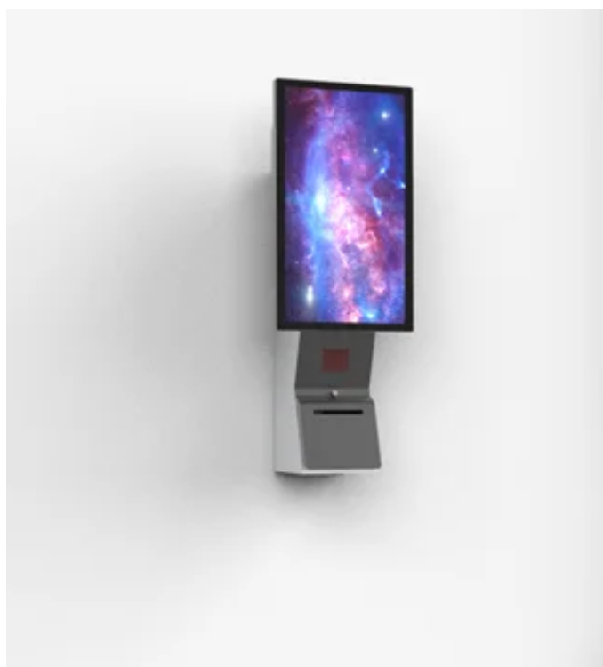
ウォールマウント（壁掛け型）

壁面に取り付ける 壁掛け型 です。工場や検査施設などで、測定機器の動作モニターや操作パネルとして使用するのに適しています。