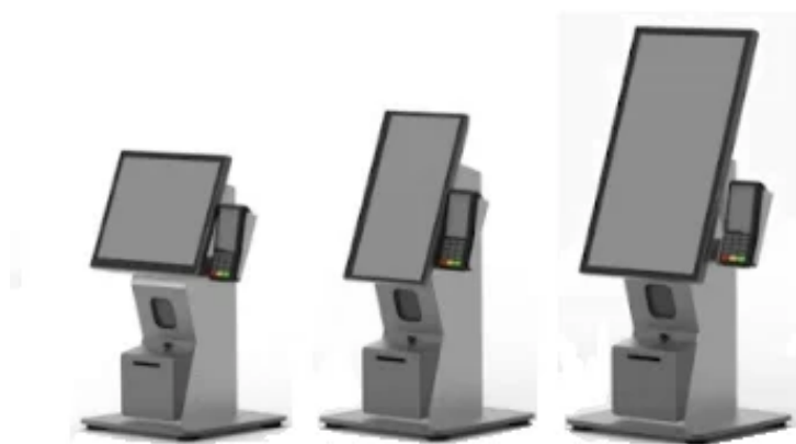
デスクトップ (カウンター置型)

新規での設置はもちろんのこと、既にレジやPOS端末が設置されている場所での入れ替えにも適しています。